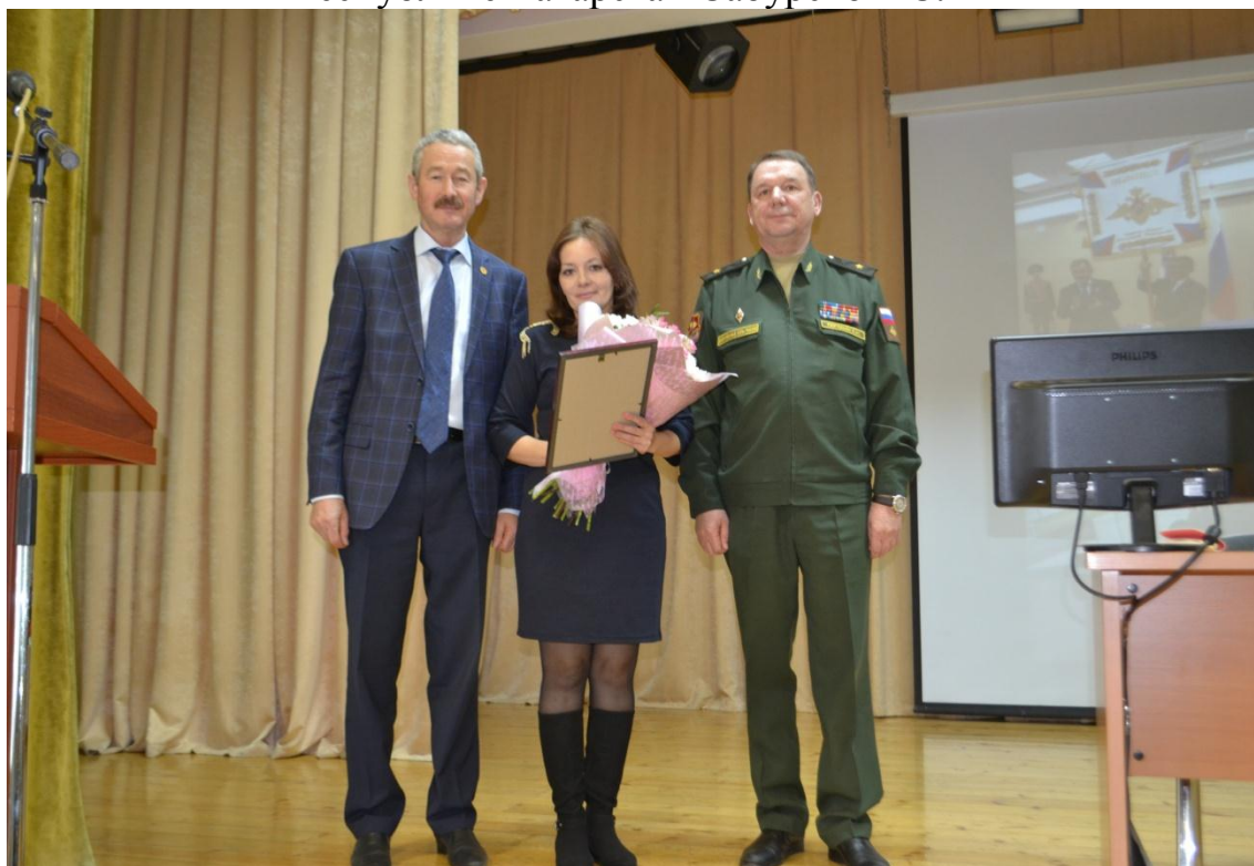
Вручение благодарственного письма от имени командира воинской части матери военнослужащего