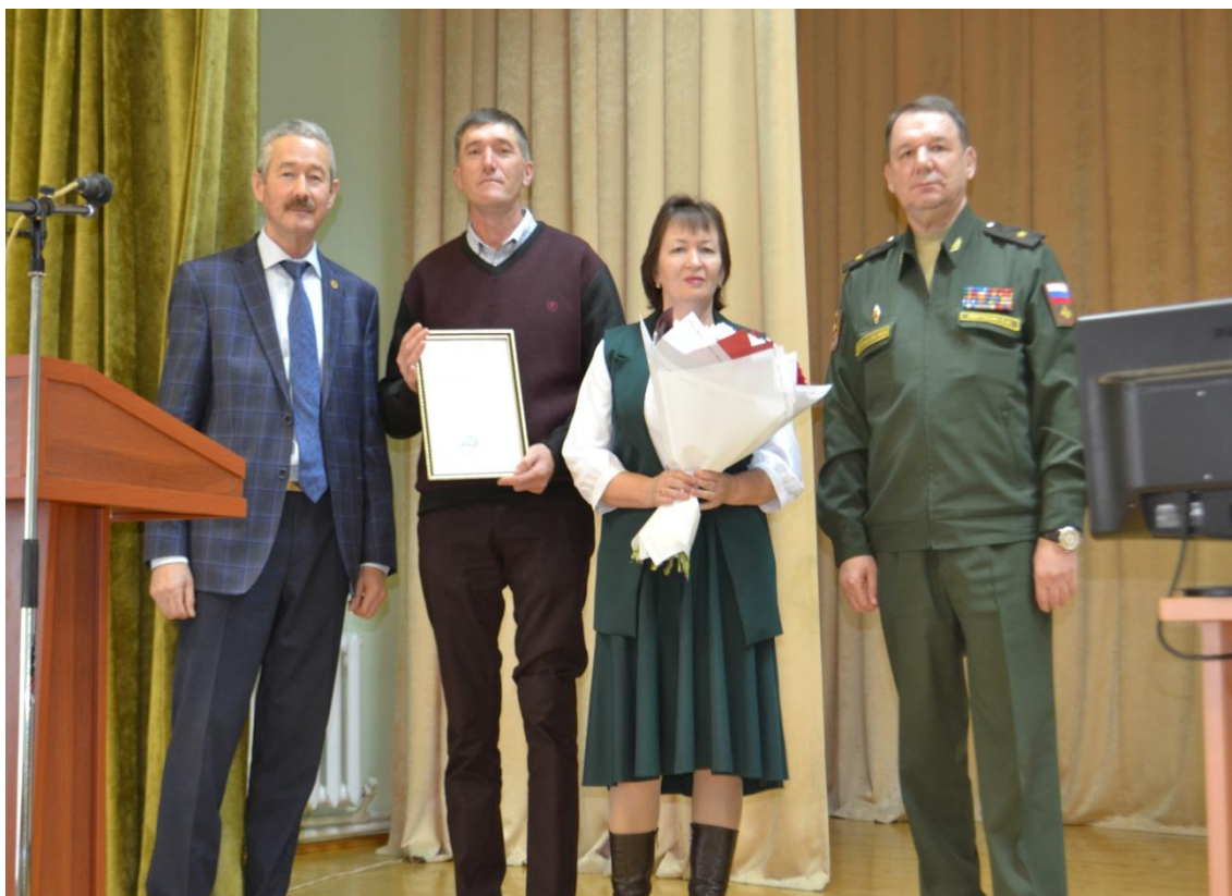
Вручение служебной характеристики от имени командира воинской части родителям военнослужащего