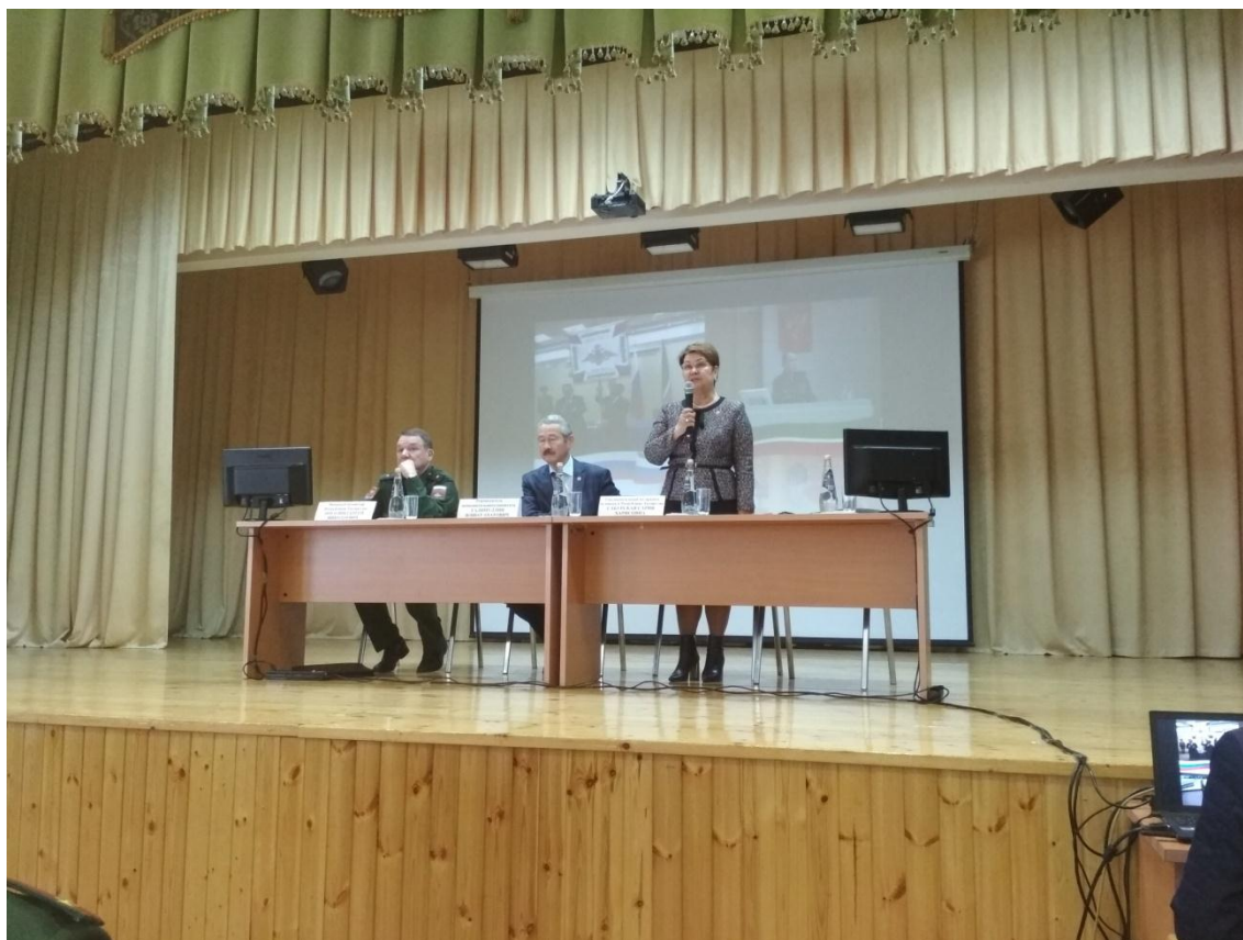
Выступление Уполномоченного по правам человека в Республике Татарстан Сабурской С.Х